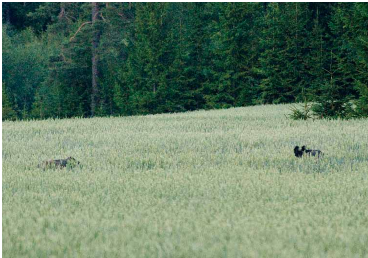
I hög säd är det inte säkert att man kan avgöra om vildsvinet är skjutbart. Då gäller det att vara fräck och smyga in på mycket nära håll.

Tyskarna jagar som bekant gärna från torn eller hochsitz som det heter på tyska. För skyddsjakten har man då ofta torn som sitter på släpvagnar eller på annat sätt är mobila. Då kan man ställa tornen vid de fält som man närmast avser att jaga.