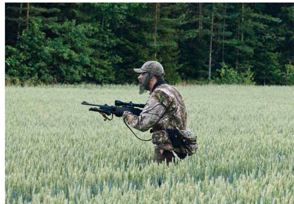
Med bra vind och kamouflage kan en duktig smygjägare nå fina framgångar i sprutspåren.

på pass där man kan se ett eller flera sådana områden. Med lite tur kommer de ut där det går att urskilja om det är ett ungdjur eller en förande sugga. Då är det snabba beslut som gäller. Även den mest erfarna och omdömesgilla jägaren kan i dessa lägen lätt skjuta fel individ.