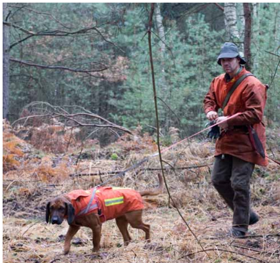
Eftersöksjägaren och hund i full utrustning för eftersök.

förarna släpper sina hundar kl 09.00 och klockan 12.00 är det "hahnruet", det vill säga skottförbud.