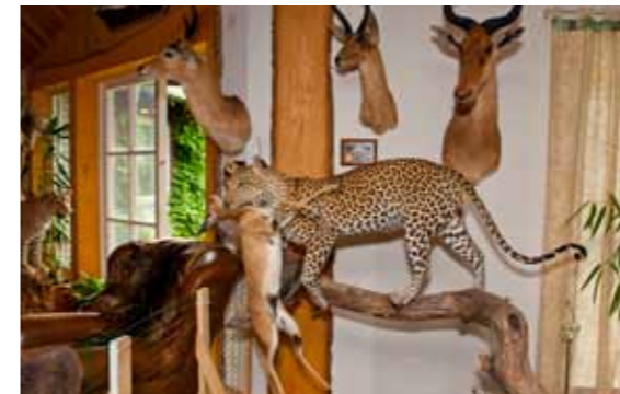
En av de leoparder Torsten fällt.