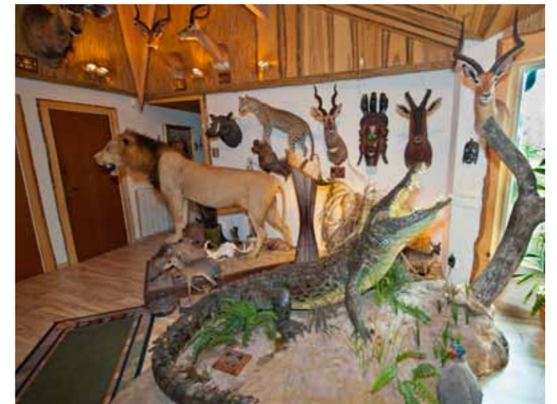
Krokodil på en liten ö i vardagsrummet.