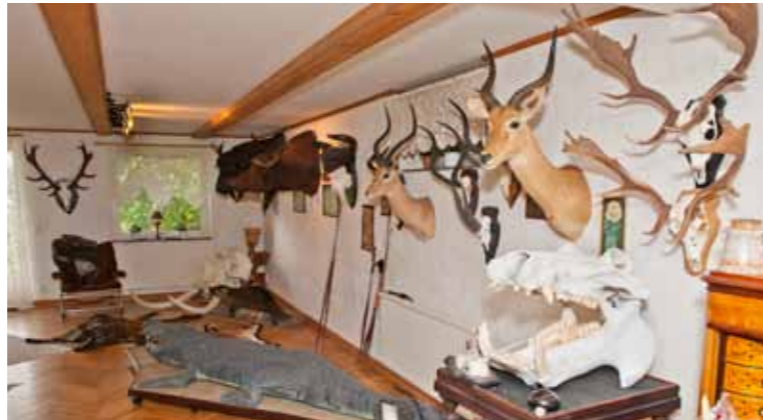
På nedre plan trängs afrikanskt vilt med vilt från andra delar av världen.