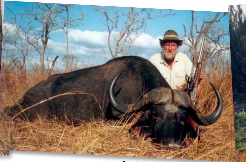
En av de 10 bufflar som fallit för Torstens kulor. Denna föll i Gombe i Tanzania 2005.