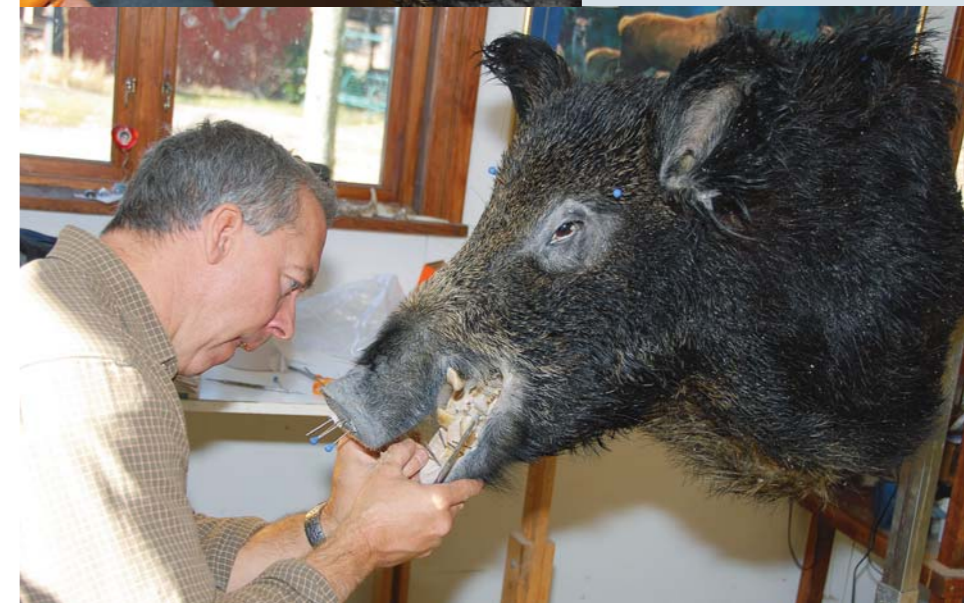
Nu börjar det likna något.