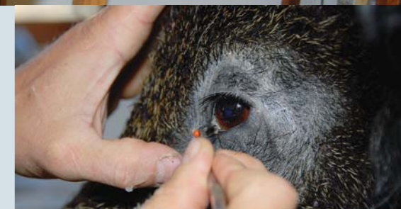
Ögonen läggs till rätta och fixeras med nålar.