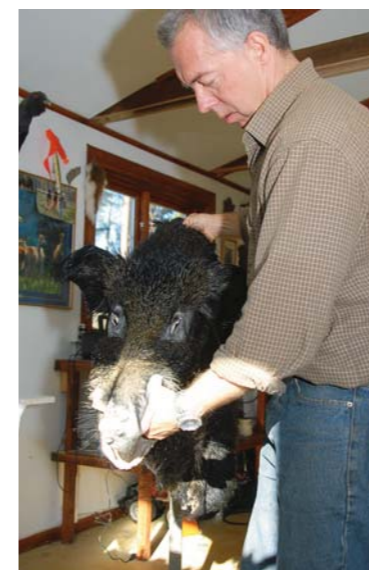
Pälsen träs över mannekängen.