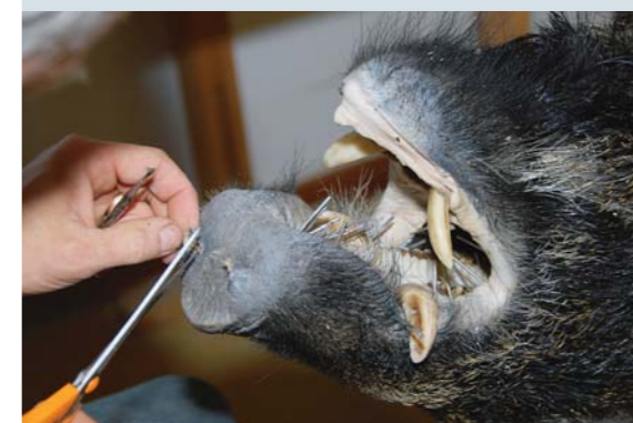
Läppar och tryne fixeras på rätt plats med hjälp av nål och spik.