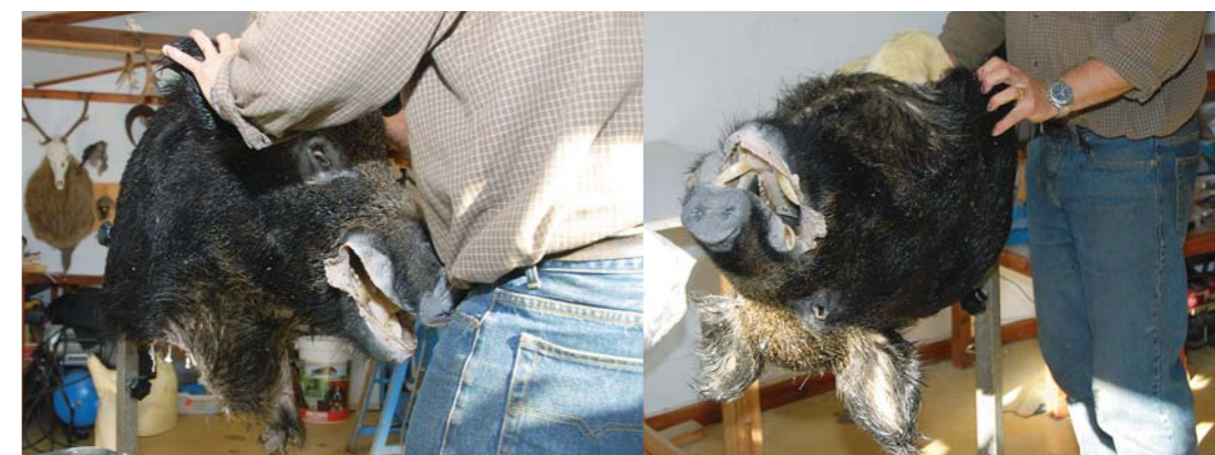
Pälsen fästs upp på mannekängen med spik.

I vissa fall har speciella drag modellerats fram med modellera. Modellen penslas med helt van-