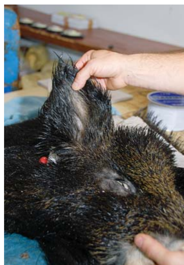
Genom att fylla öronen med glasfiberspäckel formas dessa till naturligt utseende.