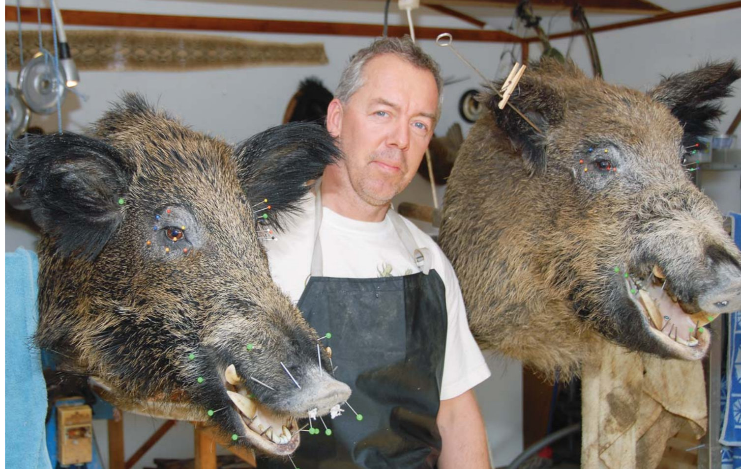
Montage på tork.