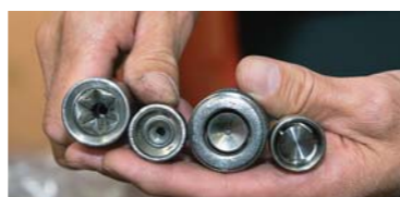
Här de verktyg som används för att stjärnstuka en patron. Man börjar med att vika in kanterna lite för att sedan pressa materialet till sin slutliga stjärnstukade form.