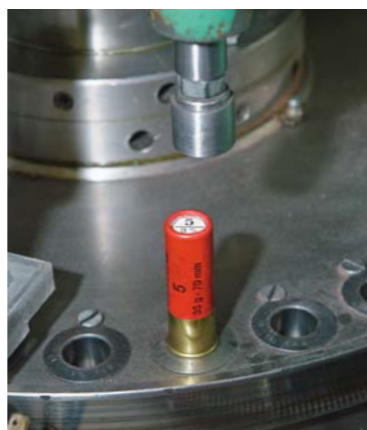
En traditionellt rullstukad patron i en revolvermaskin där pressverktyg slutligen format patronens stukning.