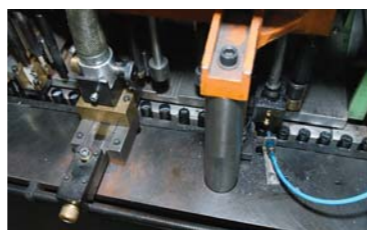
Här fylls Steel Max-patroner. Maskinen matas med plasthylsor med culot och tändhatt. I maskinen fyller man krut, förladdning och hagel för att slutligen stjärnstuka toppen på hylsan.