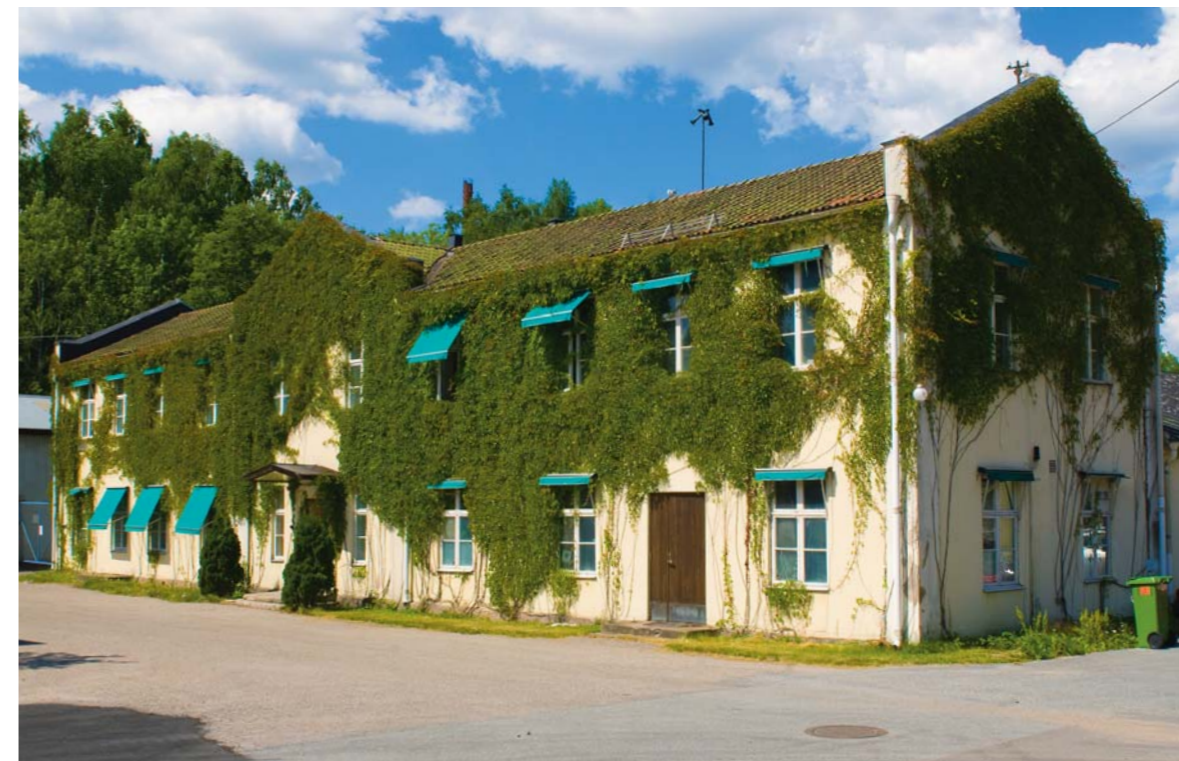
I denna tämligen anspråklösa byggnad i Noras lilla industriområde tillverkas i dag de för skyttar och jägare så välkända Gyttorp-patronerna.

Gyttorp har de senaste åren framträtt som något av en stålhagel-specialist i Europa. Att tillverka stålhagelpatroner anses som svårare än bly eller andra alternativa